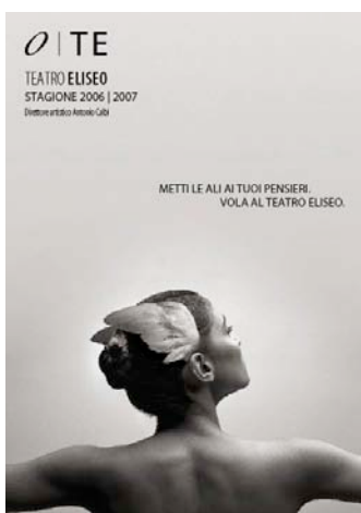
Cover programma 06 07