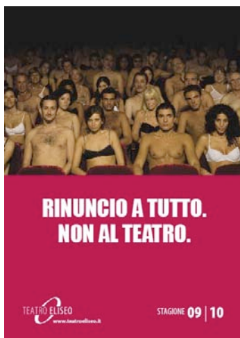
Cover programma 09 10