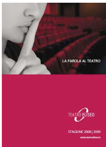
Cover programma 08 09