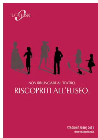
Cover programma 10 11

Tra gli inserzionisti abbiamo il piacere di annoverare: